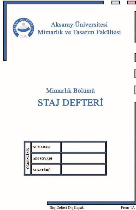
Staj Dış Kapak Örneği (1A)

Staj A3 ek sayfalar örneği (1D) formlarını düzenleyerek staj defterinizi ilk günden başlayarak düzenli olarak son güne kadar oluşturunuz.